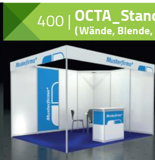
Beispiel mit Sonderausstattung*

400 | OCTA_Standard A (Wände, Blende, Teppichboden, Mobiliar)