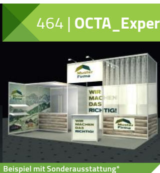
Beispiel mit Sonderausstattung*