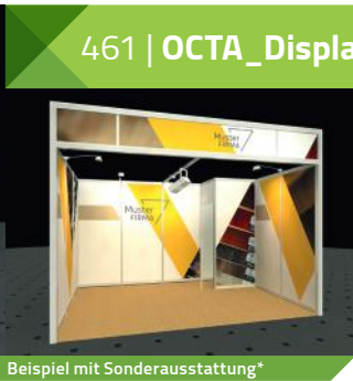
Beispiel mit Sonderausstattung*