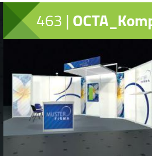
Beispiel mit Sonderausstattung*