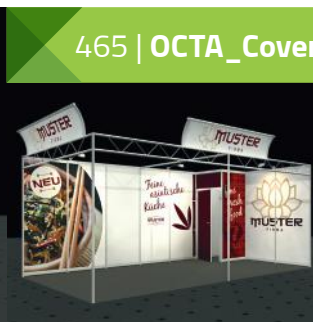
Beispiel mit Sonderausstattung*