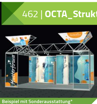
Beispiel mit Sonderausstattung*